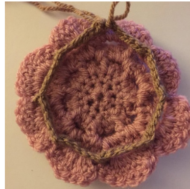
2 8 K ruimtes