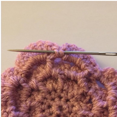
1 Pak de achterkant van de vaste

Totaal= 8 voor het stokje langs vaste of fpvc, 8 K5 ruimtes.