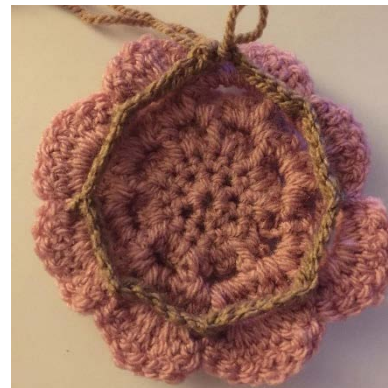
2 Acht Luftmaschenketten