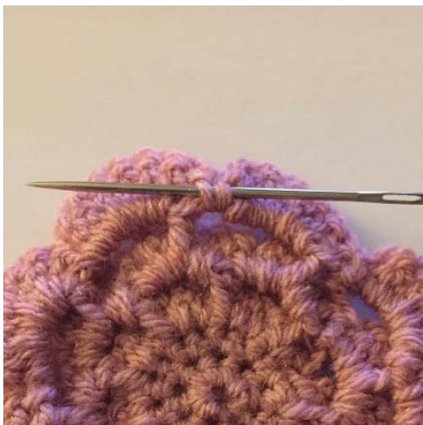
1 Die rückwärtigen Stränge der fM aufnehmen